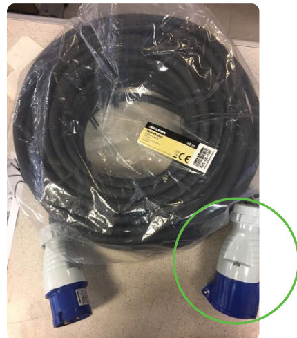
230 V 16 A Kabel Art. 46-186 med kobling