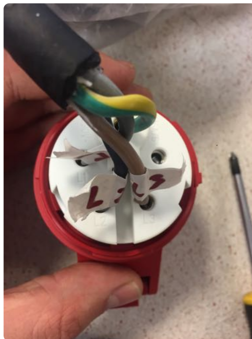
Fest ledningene på tilsvarende koblingspunkter på 380 V kobling

Test deretter på maskin og se om motor går rett vei. Hvis sagbladet går feil vei, må to ledninger bytte plass. Plugg da ledning ut av veggkontakten og bytt om på to av ledningene som vist under: