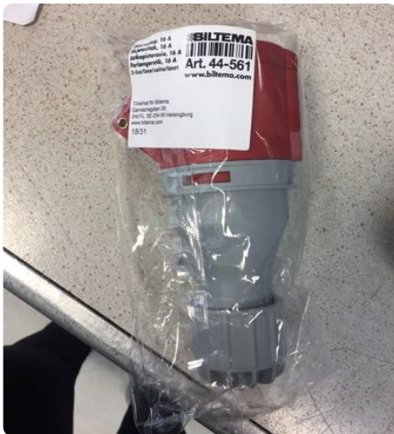
16 A Kobling Art. 44-561 passer i sag

Man trenger; en 380 V 16 A hun plugg som passer i kontakten på sagen, en 230V han plugg som passer i kontakten på veggen, og en 230 V 16 A ledning. Komponentene som er vist under er fra Biltema.