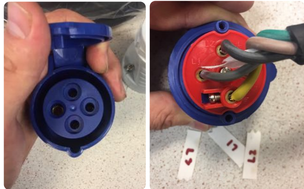
Tilsvarende merking med L1, L2, L3 og jord