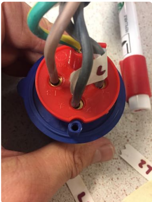
Merk alle ledningene før de skrues løs fra 230V pluggen.