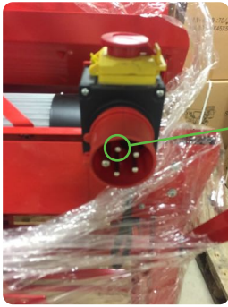
Vedkappsag LS 700

Motoren på vedkappsagen er 3 Faset og av 230 V type, levert fra fabrikk med en 380 V plugg. Sagen trenger derfor en overgang til en 230 V kontakt for å kunne brukes.